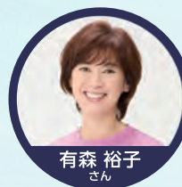
有森 裕子 さん