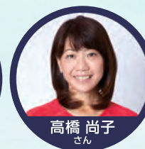
高橋 尚子 さん