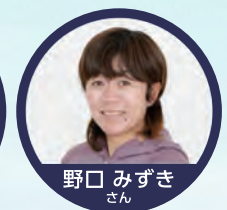
野口 みずき さん